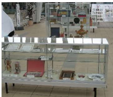
国際交流事業の記念品も展示

全体の様子↑ 公文書や写真パネル・展示品・協会の発行誌などを展示しました。 日本・鈴鹿市・鈴鹿国際交流協会と鈴鹿市の外国人登録上位10カ国の国旗も飾りました。