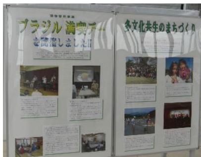
協会の事業をパネルで紹介