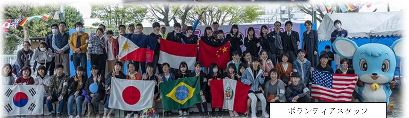
ボランティアスタッフ