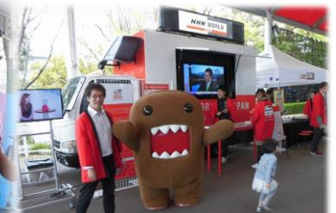
NHKワールドの啓発トラックととーもくん