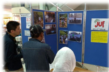
国際交流活動団体の紹介